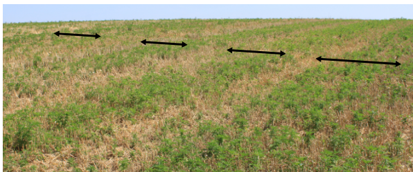
« Bandes d'ambrosies » laissées par la moissonneuse-batteuse »